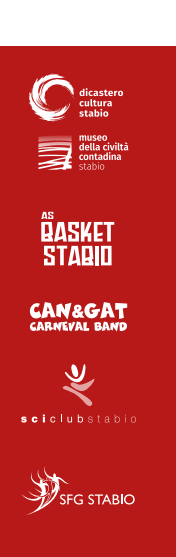
illustrazione: Alice Paloni